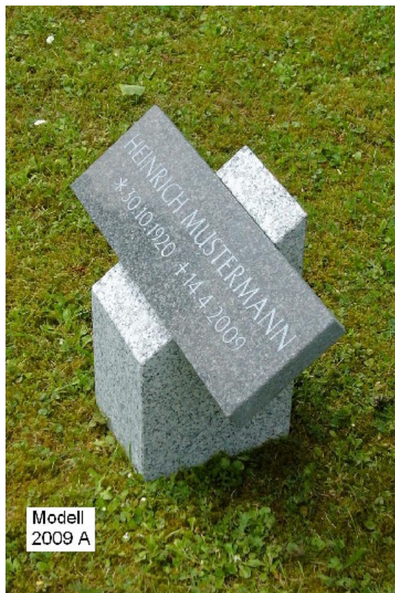
Modell 2009 A