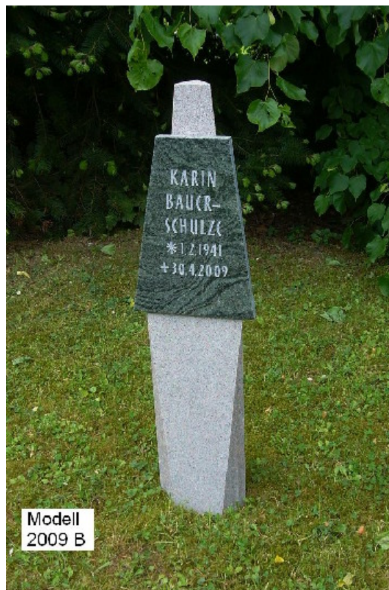
Modell 2009 B