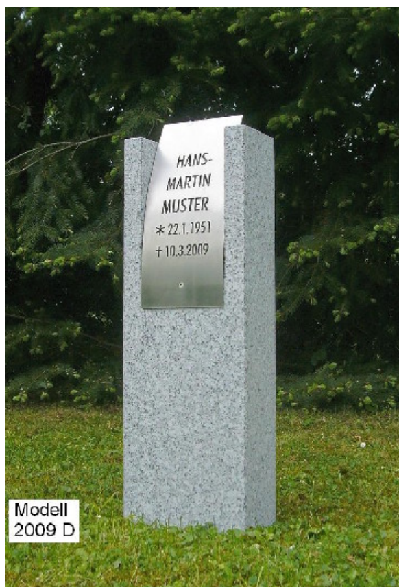
Modell 2009 D